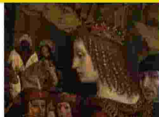
In alto: Ambrogio da Fossano detto Bergognone, Cristo di Pietà con angeli e un monaco inginocchiato, ante 1480. Gazzada Schianno (Va). Collezione d'arte Cagnola.